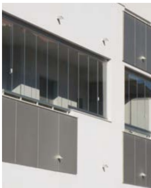
BALCONS / LOGGIAS