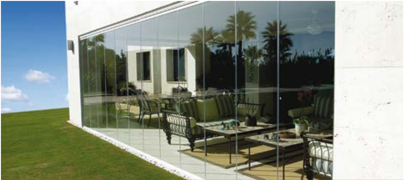
FERMÉ Augmente votre surface habitable et vous protège contre les intempéries