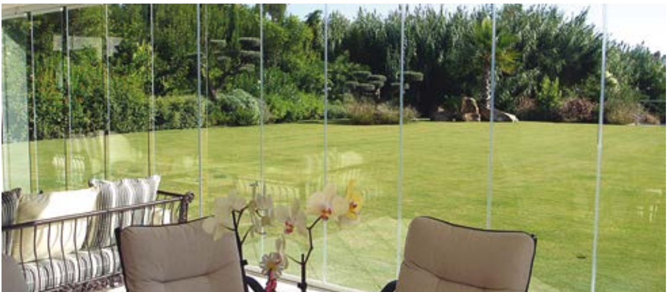
INTÉRIEUR Profitez d'une vue panoramique, grâce au système sans profils