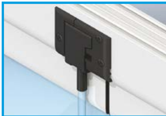
Accessoires en noir ou blanc