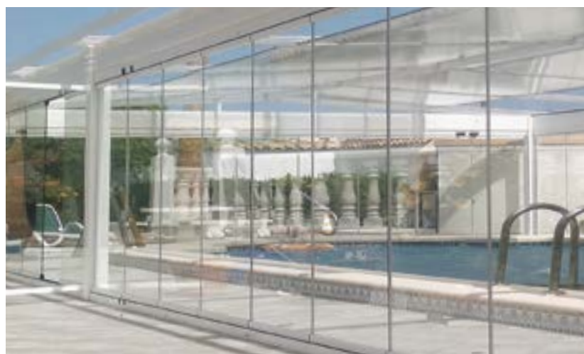
PISCINES / POOL HOUSE