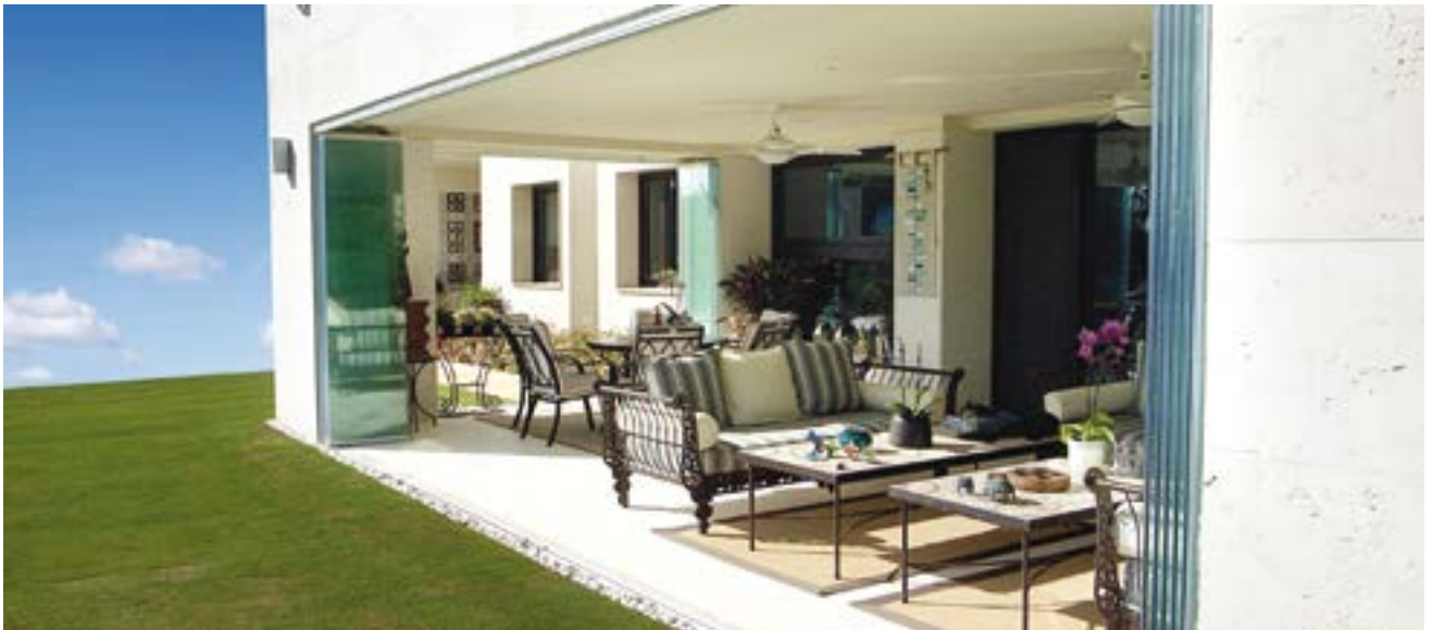
OUVERT L'espace se libère intégralement, en glissant et pivotant chacun des vantaux